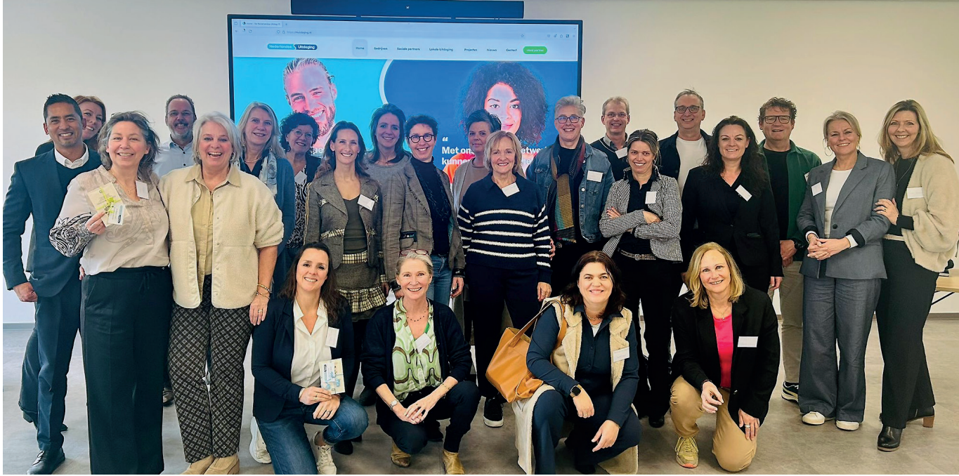
De managers van alle Uitdagingen tijdens de managersdag van de Nederlandse Uitdaging

Een vereniging die een buurthuis wil opknappen maar geen verf heeft. Een bedrijf met overtollige bureaustoelen die nog prima een tweede ronde mee kunnen. Een stichting die op zoek is naar juridisch advies. In de Liemers hoeven deze vragen niet onbeantwoord te blijven. De Liemerse Uitdaging brengt maatschappelijke organisaties en bedrijven bij elkaar om samen iets moois neer te zetten - zonder dat er geld aan te pas komt.